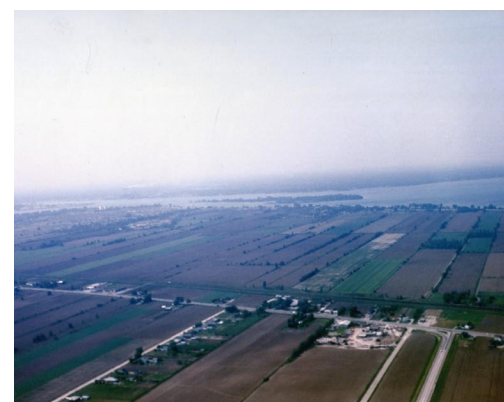
French-Canadian farm lots in the Windsor area, c. 1966