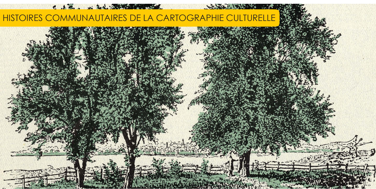
Poirier des Jésuites