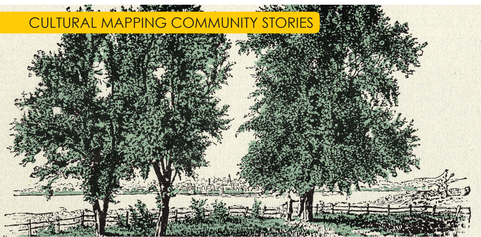
Jesuit Pear Tree